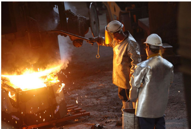
Le travail en fonderie nécessite l'établissement d'un bilan thermique par des intervenants spécialisés

Dans certaines situations de travail exposant à la chaleur (sidérurgie, verrerie...), il est indispensable d'établir un bilan thermique précis. Pour cela, il faut avoir recours à des méthodes d'évaluation plus complexes et plus difficiles à mettre en œuvre par des non spécialistes. Ces méthodes sont étroitement liées à la réponse du corps humain face à la chaleur. Outre la température ambiante et le taux d'humidité, elles prennent en compte d'autres paramètres intervenant dans la sensation de chaleur (présence d'objets chauds dans l'environnement, mouvements de l'air, apport solaire, transpiration...).