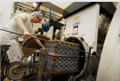
Stérilisation des boîtes dans une conserverie