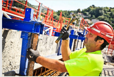
Chantiers de BTP en été