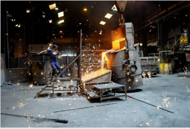
Travail en fonderie

Pour les activités qui se déroulent à l'extérieur, comme dans les secteurs du bâtiment, des travaux publics, des travaux agricoles ou des transports, le soleil est la principale source de chaleur. Si bien que les travailleurs exposés à la chaleur sont très nombreux, surtout en été.