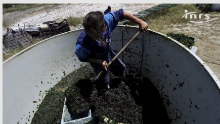
Travail et fortes chaleurs (Anim-154)

De nombreux métiers obligent les salariés à évoluer dans des environnements marqués par des températures élevées : hauts fourneaux, teintureries, blanchisseries, cuisines, mines, fonderies, ateliers de soudure... D'autres personnes travaillent en extérieur et peuvent être exposées à la chaleur, notamment en été lors des épisodes caniculaires. Ces ambiances thermiques peuvent avoir de graves effets sur la santé et augmenter les risques d'accidents du travail.